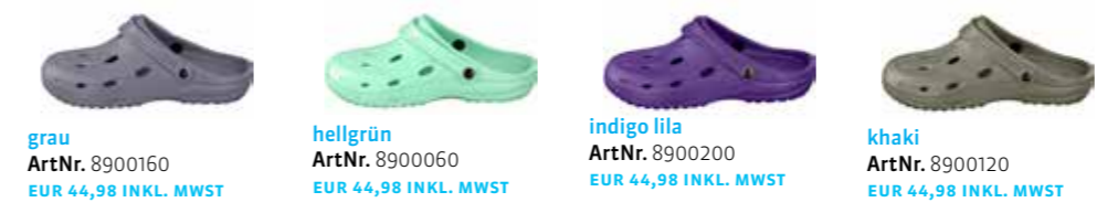
grau ArtNr. 8900160 EUR 44,98 INKL. MWST hellgrün ArtNr. 8900060 EUR 44,98 INKL. MWST indigo lila ArtNr. 8900200 EUR 44,98 INKL. MWST khaki ArtNr. 8900120 EUR 44,98 INKL. MWST