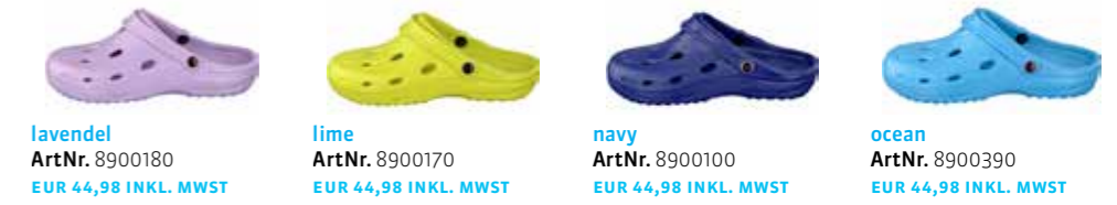
lavendel ArtNr. 8900180 EUR 44,98 INKL. MWST lime ArtNr. 8900170 EUR 44,98 INKL. MWST navy ArtNr. 8900100 EUR 44,98 INKL. MWST ocean ArtNr. 8900390 EUR 44,98 INKL. MWST