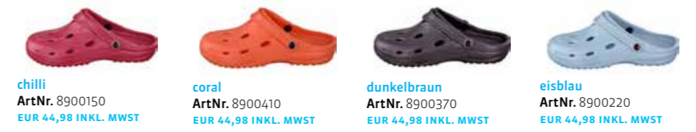
chilli ArtNr. 8900150 EUR 44,98 INKL. MWST coral ArtNr. 8900410 EUR 44,98 INKL. MWST dunkelbraun ArtNr. 8900370 EUR 44,98 INKL. MWST eisblau ArtNr. 8900220 EUR 44,98 INKL. MWST