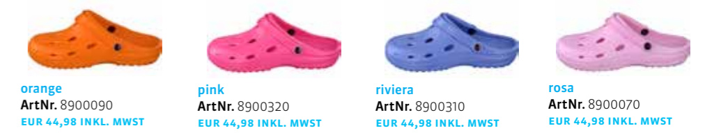
orange ArtNr. 8900090 EUR 44,98 INKL. MWST pink ArtNr. 8900320 EUR 44,98 INKL. MWST riviera ArtNr. 8900310 EUR 44,98 INKL. MWST rosa ArtNr. 8900070 EUR 44,98 INKL. MWST