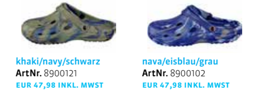
khaki/navy/schwarz ArtNr. 8900121 EUR 47,98 INKL. MWST nava/eisblau/grau ArtNr. 8900102 EUR 47,98 INKL. MWST