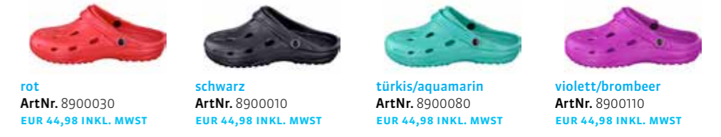
rot ArtNr. 8900030 EUR 44,98 INKL. MWST schwarz ArtNr. 8900010 EUR 44,98 INKL. MWST türkis/aquamarin ArtNr. 8900080 EUR 44,98 INKL. MWST violett/brombeer ArtNr. 8900110 EUR 44,98 INKL. MWST