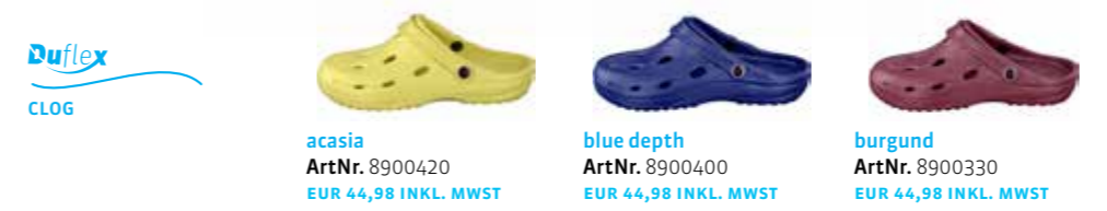
acasia ArtNr. 8900420 EUR 44,98 INKL. MWST blue depth ArtNr. 8900400 EUR 44,98 INKL. MWST burgund ArtNr. 8900330 EUR 44,98 INKL. MWST