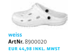
weiss ArtNr. 8900020 EUR 44,98 INKL. MWST