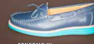
SENSOMO IV ART.NR. 8200041 EUR 149,98