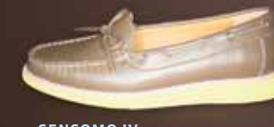
SENSOMO IV ART.NR. 8200040 EUR 149,98