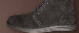
SENSOMO V ART.NR. 8200050 EUR 179,98

SENSOMO / DAMEN // GRÖSSEN 36,0 - 42,0 // IN HALBEN GRÖSSENSCHRITTEN