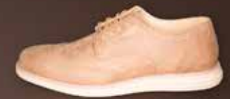
SENSOMO I ART.NR. 8200012 EUR 159,98