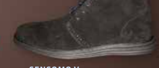
SENSOMO V ART.NR. 8200060 EUR 179,98