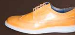
SENSOMO I ART.NR. 8200011 EUR 179,98 EUR

SENSOMO / HERREN // GRÖSSEN 41,0 - 47,0 // IN HALBEN GRÖSSENSCHRITTEN