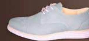
SENSOMO II ART.NR. 8200021 EUR 159,98 EUR

SENSOMO / DAMEN // GRÖSSEN 36,0 - 42,0 // IN HALBEN GRÖSSENSCHRITTEN