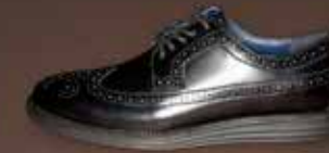
SENSOMO I ART.NR. 8200010 EUR 179,98