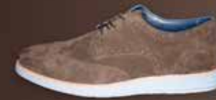
SENSOMO I ART.NR. 8200013 EUR 159,98