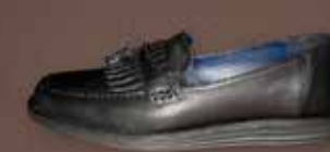
SENSOMO III ART.NR. 8200030 EUR 149,98,