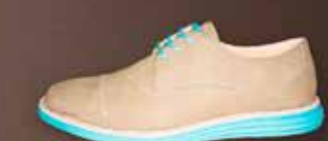
SENSOMO II ART.NR. 8200022 EUR 159,98