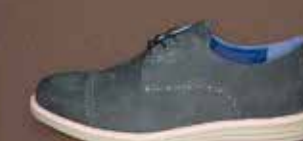
SENSOMO II ART.NR. 8200020 EUR 159,98