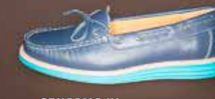
SENSOMO IV ART.NR. 8200041 EUR 149,98