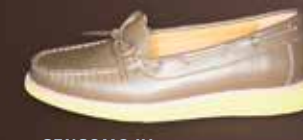
SENSOMO IV ART.NR. 8200040 EUR 149,98