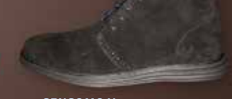
SENSOMO V ART.NR. 8200060 EUR 179,98